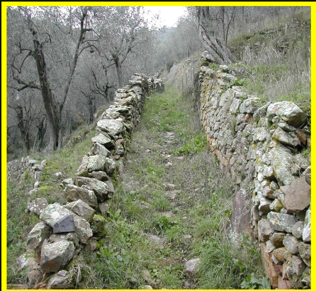
Strada vicinale del casone